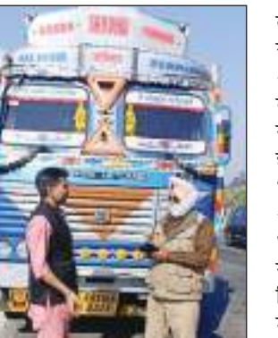
भाग 5 अन्तर्गत सुनिश्चित करेंगे कि प्रत्येक भारी वाहन व गति प्रतिबन्धित वाहन अपनी निर्धारित गति सीमा में

के नियमों की पालना दृढ़ता से करवाई जाए। मोटर वाहन अधिनियम-2017 की धारा 4 के भाग 5 के अन्तर्गत निर्धारित गति सीमा व बाईं लेन में ना चलकर नियमों की उल्लंघना करने पर आज 25 फरवरी 2023 को 57 भारी वाहनों के चालान किए और अब तक बीते 294 दिनों में 12691 भारी वाहनों के चालान किए जा चुके हैं। पुलिस अधीक्षक अम्बाला ने उप-पुलिस अधीक्षक, यातायात अम्बाला व प्रबन्धक थाना यातायात को निर्देश दिए थे कि आप मोटर वाहन अधिनियम-2017 की धारा 4 के