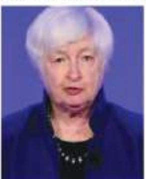
जेनेट येलेन ने भारत को अमेरिका का सबसे बड़ा व्यापारिक साझेदार करार दिया। उन्होंने कहा कि इस आपूर्ति शृंखलाओं के लचीलेपन को मजबूत करने के लिए 'फंडेशोरिंग' (दोस्ताना संबंध) के नजरिए से आगे बढ़ेंगे।

क्षेत्र की शीर्ष हस्तियां मौजूद थीं। उन्होंने कहा कि भविष्य के लिए मैं प्रौद्योगिकी क्षेत्र में अपने संबंधों को मजबूत करने की इच्छा है। अमेरिका अपनी आपूर्ति शृंखलाओं का लचीलापन बढ़ाने के लिए फंडेशोरिंग का रवैया अपनाने की दिशा में आगे बढ़ रहा है। हम इसे भारत जैसे अपने भरोसेमंद कारोबारी साझेदारों के साथ एकीकरण कर अंजाम तक पहुंचा रहे हैं। मसलन गूगल और ऐपल जैसे प्रौद्योगिकी कंपनियां भारत में अपने फोन का उत्पादन बढ़ा रही हैं। दरअसल फंडेशोरिंग के तहत कच्चा माल एवं आपूर्ति शृंखला को भी साझा मूल्यों वाले देशों से ही मंगाया जाता है।