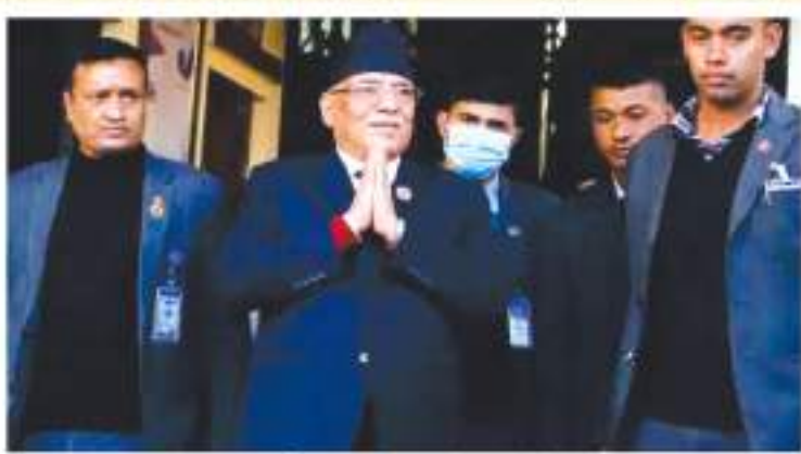
नेपाल की संसद में 275 सीट है, जिसमें RPP की 14 सीटें हैं। इसके साथ ही वो 5वीं सबसे बड़ी पार्टी है। इस्तीफा देने वाले मंत्रियों के पास कई अलग विभाग थे। नेपाल के PM ऑफिस ने 4 मंत्रियों के इस्तीफे की बात स्वीकार की है।

काठमांडू। नेपाल में दो महीने पहले बनी पुष्प कमल दहल की सरकार से उप-प्रधानमंत्री राजेन्द्र सिंह लिंगदेन समेत राष्ट्रीय प्रजातंत्र पार्टी के 4 मंत्रियों ने इस्तीफा दे दिया है। दरअसल, प्रचंड की सरकार ने गठबंधन से बाहर जाकर राष्ट्रपति पद के लिए विपक्षी पार्टी नेपाली कांग्रेस के रामचंद्र पौडेल को समर्थन देने की घोषणा की है। इससे नाराज RPP के मंत्रियों ने सरकार से इस्तीफा दे दिया है। हालांकि, जिन मंत्रियों ने इस्तीफा दिया है, उनकी पार्टी ने अब तक आधिकारिक तौर पर सरकार से समर्थन वापस नहीं लिया है। अगर ऐसा होता है तो प्रचंड सरकार खतरे में आ सकती है।