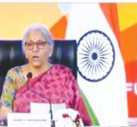
समूह गठित करने के भारत के प्रस्ताव का समर्थन करने के बारे में एक साझा रुझान तय किया गया है। उन्होंने कहा कि इस बैठक की एक और सफलता के बारे में बताया कि कर्ज के बारे में एक साझा रुझान तय किया गया है।

नई दिल्ली/बैंगलुरु। भारत की अध्यक्षता में जी-20 वित्त मंत्रियों और केंद्रीय बैंक गवर्नरों (एफएमसीबीजी) की पहली बैठक में भारत की प्राथमिकताओं को बहुत से सदस्यों का समर्थन मिला है। केंद्रीय वित्त मंत्री निर्मला सीतारमण ने बैंगलुरु में आयोजित दो दिवसीय बैठक के संपन्न होने पर आयोजित प्रेस कॉन्फ्रेंस में यह बात कही। सीतारमण ने यहां आयोजित प्रेस कॉन्फ्रेंस को संबोधित करते हुए कहा कि जी-20 की भारतीय अध्यक्षता में दो दिन चली एफएमसीबीजी की पहली बैठक में भारत की प्राथमिकताओं को बहुत से सदस्यों का समर्थन मिला है। वित्त मंत्री ने कहा कि विश्व स्तर पर वित्तीय चुनौतियों का मुकाबला करने के लिए एक विशेषज्ञ समूह गठित करने के भारत के प्रस्ताव का समर्थन करने के बारे में एक साझा रुझान तय किया गया है। उन्होंने कहा कि इस बैठक की एक और सफलता के बारे में बताया कि कर्ज के बारे में एक साझा रुझान तय किया गया है। उन्होंने कहा कि यह बैठक की एक और सफलता के बारे में बताया कि कर्ज के बारे में एक साझा रुझान तय किया गया है। उन्होंने कहा कि यह बैठक की एक और सफलता के बारे में बताया कि कर्ज के बारे में एक साझा रुझान तय किया गया है।