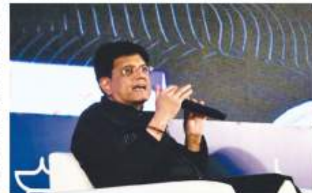
केंद्रीय वाणिज्य एवं उद्योग मंत्री पीयूष गोयल ने एशिया आर्थिक संवाद कार्यक्रम के दौरान यह बात कही। गोयल ने कहा कि जिस दर से देश की अर्थव्यवस्था बढ़ रही है, यह 2047 तक 35-40 ट्रिलियन डॉलर तक पहुंच सकती है।

नई दिल्ली/पुणे। भारती आगामी कई दशकों तक दुनिया की सबसे तेजी से बढ़ती बड़ी अर्थव्यवस्था बना रहेगा। भारत चार-पांच वर्षों के भीतर ये दुनिया की तीसरी सबसे बड़ी वैश्विक अर्थव्यवस्था होगी। केंद्रीय वाणिज्य एवं उद्योग मंत्री पीयूष गोयल ने एशिया आर्थिक संवाद कार्यक्रम के दौरान यह बात कही। गोयल ने कहा कि जिस दर से देश की अर्थव्यवस्था बढ़ रही है, यह 2047 तक 35-40 ट्रिलियन डॉलर तक पहुंच सकती है। यह दर भारतीय की इच्छा है कि यह किसी से पीछे न रहे और भारत न केवल सबसे तेजी से बढ़ती अर्थव्यवस्था है बल्कि आने वाले कई दशकों तक ऐसा ही रहेगा। वाणिज्य मंत्री ने कहा कि हम पहले ही दुनिया की 10वीं सबसे बड़ी अर्थव्यवस्था से 5वीं सबसे