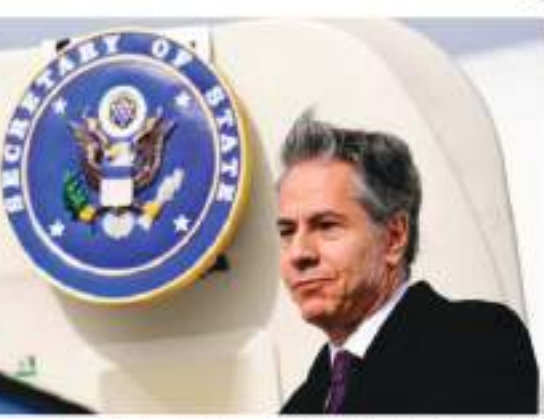
की तरफ से बार-बार परमाणु हमले की धमकी दी गई। यह निश्चित रूप से चिंता का विषय है। उन्होंने कहा कि अमेरिका ने चीन और भारत सहित उन देशों से युद्ध को खत्म करवाने का आग्रह किया, जिनके संबंध रूस से अच्छे हैं। इसका असर भी हुआ। भारत और चीन ने रूस को यूक्रेन पर परमाणु हमला करने से रोकने की पहल की और वह प्रयास सफल भी हुआ। अमेरिकी विदेश मंत्री ने कहा कि पिछले कई दशकों से भारत को रूस से सैन्य उपकरण मिलते थे। पिछले कुछ वर्षों में देखा गया कि भारत ने रूस पर भरोसा करने के साथ अमेरिका और फ्रांस जैसे अन्य देशों के साथ भी साझेदारी बढ़ाई है। इस तरह भारत ने पश्चिमी देशों पर भरोसा बढ़ाया है।

वाशिंगटन। यूक्रेन पर रूसी हमले के एक साल पूरे होने पर अमेरिकी विदेश मंत्री एंटी-ब्लिंकन ने बड़ा दावा किया है। उन्होंने कहा कि रूस के राष्ट्रपति व्लादिमीर पुतिन यूक्रेन पर काफी पहले ही परमाणु हमला कर चुके होते, किन्तु उन्हें ऐसा करने से भारत और चीन ने रोका है। एक साक्षात्कार में ब्लिंकन ने यूक्रेन पर रूसी हमले के एक साल पूरे होने पर तमाम सबालों के बेबाकी से जवाब दिये। उन्होंने कहा कि पुतिन इस युद्ध में ज्यादा तर्कहीन रूप से प्रतिक्रिया कर सकते हैं। युद्ध के दौरान मास्को