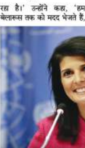
जो कि रूस के राष्ट्रपति व्लादिमीर पुतिन का सबसे करीबी दोस्त है।

कीव। हाल ही में अमेरिकी राष्ट्रपति पद के लिए उम्मीदवारों का एलान करने वाली रिपब्लिकन पार्टी की नेता निक्की हेली ने अपने चुनाव प्रचार की तैयारियां शुरू कर दी हैं। हाल ही में एक रिसर्च में सहमते आया था कि अमेरिका में उनको पसंद करने वालों की संख्या में लगातार इजाफा हो रहा है और उनकी अप्रवृत्त रेटिंग यानी उन्हें पसंद करने वालों की संख्या अमेरिकी राष्ट्रपति जो बाइडन से भी ज्यादा है। अपनी इस बढ़ती लोकप्रियता के बीच हेली ने अमेरिका की मौजूदा बाइडन सरकार को घेरना शुरू कर दिया है। हेली ने बाइडन प्रशासन की ओर से विदेश भेजी जा रही मदद को लेकर निशाना साधा। न्यूयॉर्क पोस्ट में एक ऑपिनियन लेख में उन्होंने बतया कि किस तरह अमेरिका हर साल 46 अरब डॉलर खर्च कर रहा है, जो कि चीन, पाकिस्तान और इराक जैसे देशों को जा रही है। उन्होंने कहा, 'मैं अपने दुरमनों को मदद के तौर पर भेजी जा रही फंडिंग को पूरी तरह रोक दूंगी। बाइडन प्रशासन ने पाकिस्तान सैन्य सहायक भेजना जारी रखा है और अमेरिकी टैक्सदाताओं का पैसा अभी भी कम्युनिस्ट चीन के पास कुछ हास्यास्पद जलवायु परिवर्तन से जुड़े कार्यक्रमों के नाम पर जा