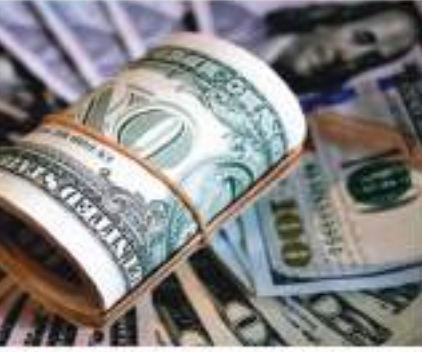
लगातार तीसरे हफ्ते गिरावट रही है। रिजर्व बैंक के मुताबिक स्वर्ण भंडार में भी लगातार तीसरे हफ्ते गिरावट रही है। स्वर्ण भंडार का मूल्य पिछले हफ्ते के दौरान 1.045 अरब डॉलर घटकर 41.817 अरब डॉलर रह गया है।

नई दिल्ली। लगातार तीसरे हफ्ते विदेशी मुद्रा और स्वर्ण भंडार में गिरावट आई है। देश का विदेशी मुद्रा भंडार 17 फरवरी को समाप्त हफ्ते में 5.681 अरब डॉलर घटकर 561.267 अरब डॉलर रह गया है। इससे पिछले हफ्ते विदेशी मुद्रा का भंडार 8.319 अरब डॉलर घटकर 566.948 अरब डॉलर रह गया था। रिजर्व बैंक ऑफ इंडिया (आरबीआई) की ओर से जारी आंकड़ों के मुताबिक 17 फरवरी को समाप्त हफ्ते में विदेशी मुद्रा भंडार 5.681 अरब डॉलर घटकर 561.267 अरब डॉलर रह गया है।